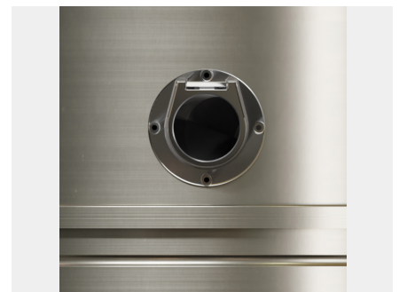
BOCCHETTONE INGRESSO CENTRALE