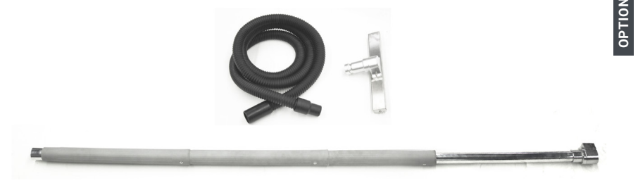
KIT FORNO: Prolunga con attacco rapido - Spazzola forni - Tubo Flessibile Super Calor