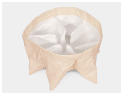
FILTRO NOMEX - ALTE TEMPERATURE