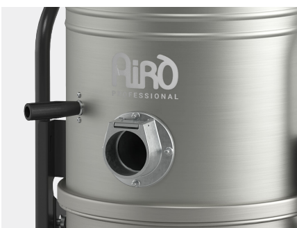
FUSTO IN ACCIAIO INOX